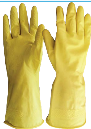
Guante multiuso amarillo