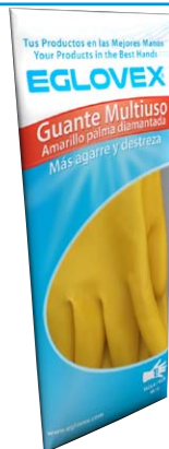
Presentación bolsa: 1 par